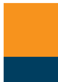
1/3 Seite 500,- €

im Anschnitt: 216 mm b x 146 mm h im Satzspiegel: 216 mm b x 127 mm