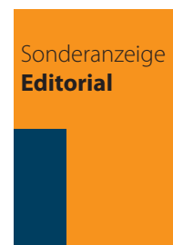
Editorial Seite 2 300,- €

im Anschnitt: 216 mm b x 146 mm h im Satzspiegel: 188 mm b x 77 mm h