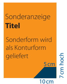
Titelseite Griffecke 300,- €

(Bitte alle Millimeter-Angaben inklusive 3mm Beschnittzugabe, außer Visitenkarte (Netto, zzgl. 19 % ges. MwSt.)