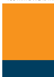
1/4 Seite quer 450,- €

im Anschnitt: 78 mm b x 286 mm h im Satzspiegel: 55,3 mm b x 243 mm h