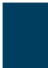
1 Seite 850,- €

im Anschnitt: 216 mm b x 286 mm h im Satzspiegel: 188 mm b x 249 mm h