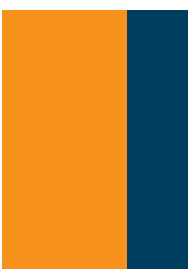
1/3 Seite Streifenband 500,- €

im Anschnitt: 78 mm b x 286 mm h im Satzspiegel: 55,3 mm b x 243 mm h