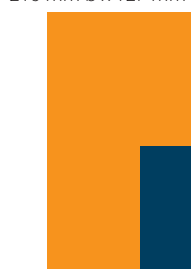
1/4 Seite hoch 450,- €

im Anschnitt: 216 mm b x 76 mm h im Satzspiegel: 189 mm b 53 mm h