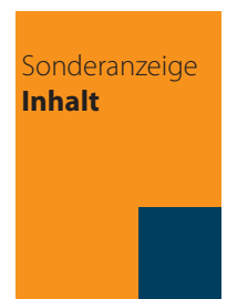
Inhalt Seite 3 350,- €

im Anschnitt: 65 mm b 140 mm h im Satzspiegel: 48 mm b x 123 mm h