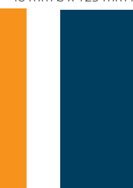
Panorama 1.350,- €

im Anschnitt: 428 mm b x 286 mm h im Satzspiegel: 392 mm b x 252 mm h