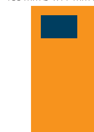
Visitenkarte 110,- €

im Anschnitt: 111 mm b x 146 mm h im Satzspiegel: 98 mm b x 126 mm h